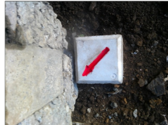
YF : コンクリート杭