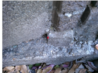
YE : コンクリート杭