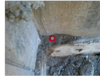
YG : 鋏