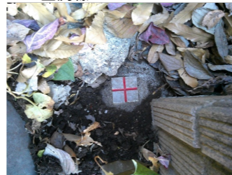
YK : 金属標