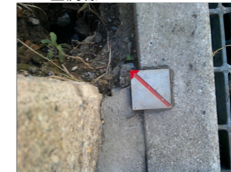
YL : 金属標