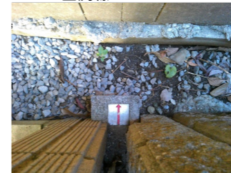
YM22 : 金属標