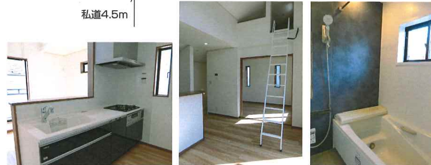
※図面と現況が異なる場合は現況優先といたします。